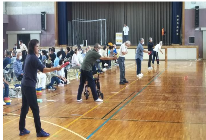
4m先の的へむかって真剣勝負！