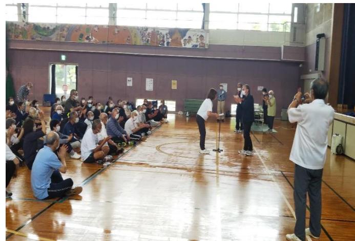
入賞おめでとうございます！